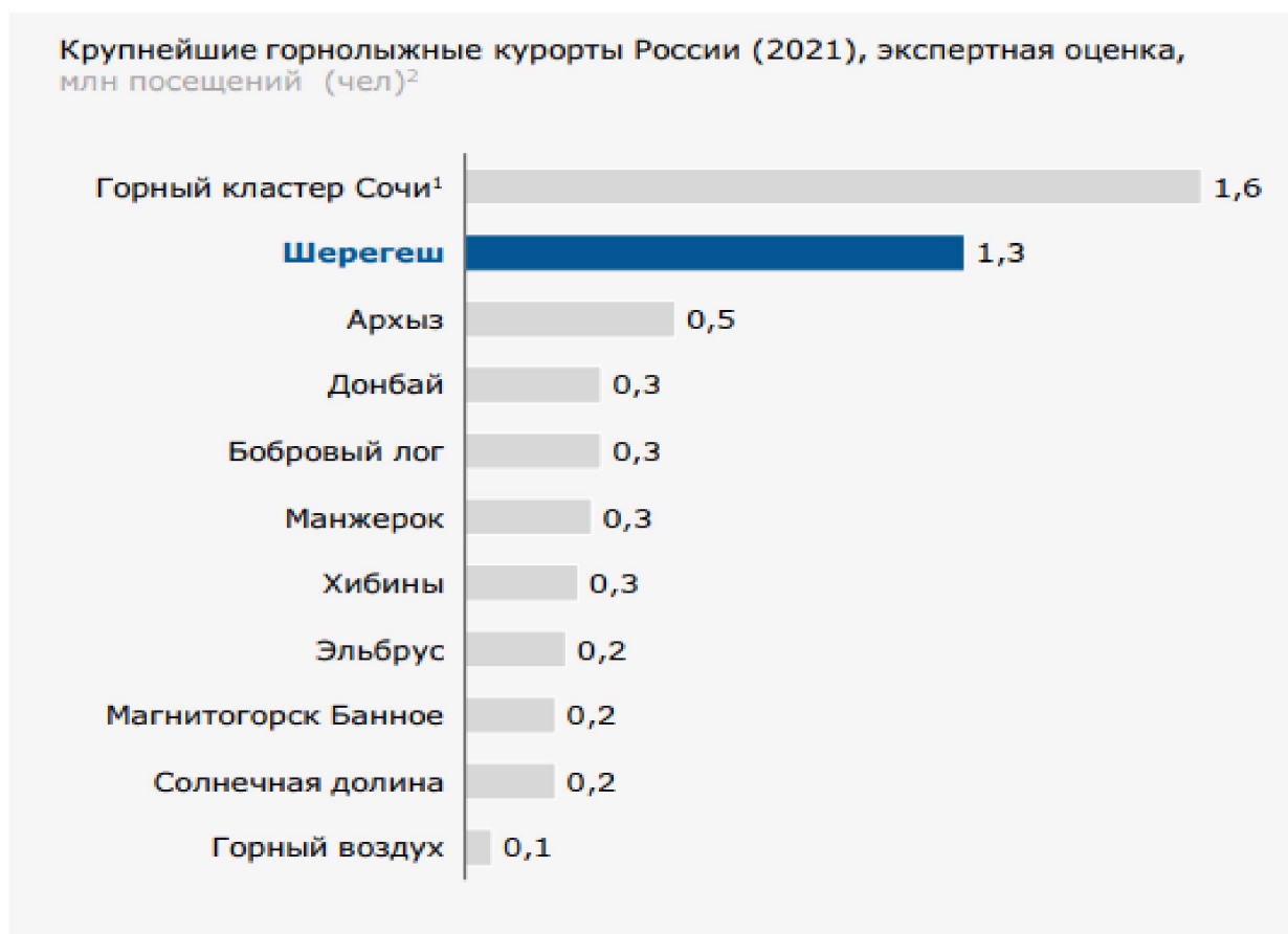
Рисунок 1. Крупнейшие горнолыжные курорты Российской Федерации по данным АО «Стратеджи Партнерс Групп»

Согласно данным АО «Стратеджи Партнерс Групп», на сегодняшний день СТК «Шерегеш» является вторым по посещаемости горнолыжным курортом Российской Федерации (рисунок 1).