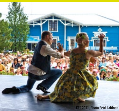
KTS 2011

Регион Куопио богат на разнообразные мероприятия круглый год! Летом вас ждут яркие праздники и фестивали на берегах многочисленных озер с музыкой и весельем уличных террас!